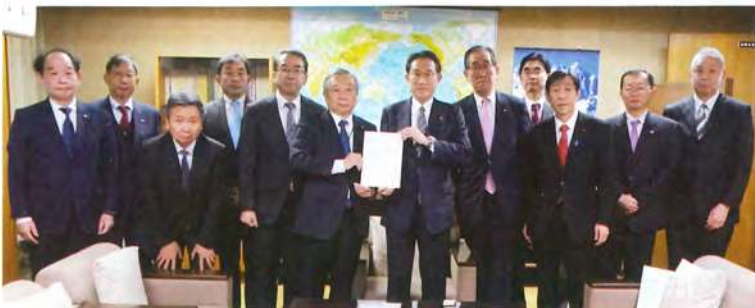
自由民主党 岸田政調会長に要望書を提出